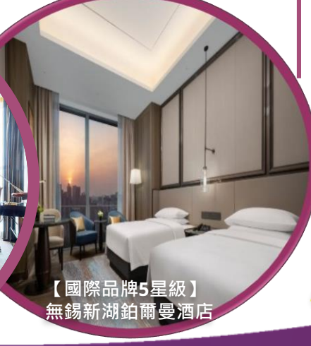
【國際品牌5星級】 無錫新湖鉑爾曼酒店