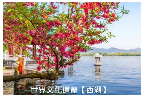
世界文化遺產【西湖】

出發日期：5月19,24,26,31日、 6月2,7,9,14,16,21,23,28,30日、 7月5,7,12,14,19,21,26,28日、 8月2,4,9,11,16,18,23,25,30日