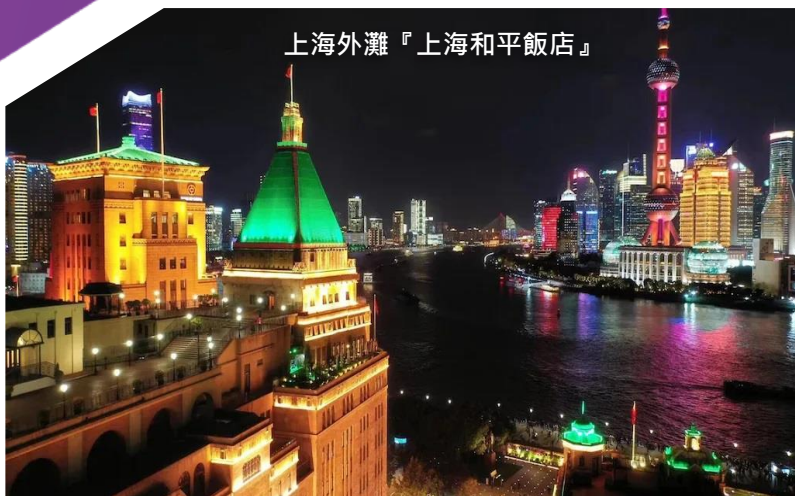
上海外灘『上海和平飯店』

※ 專業貼心服務-全程食住玩安排妥善、預留充足自由活動時間令團友盡情享受 ※ 【當地專屬配車·由經驗充足的服務人員同行下·讓您體會一個舒適安心的旅程】