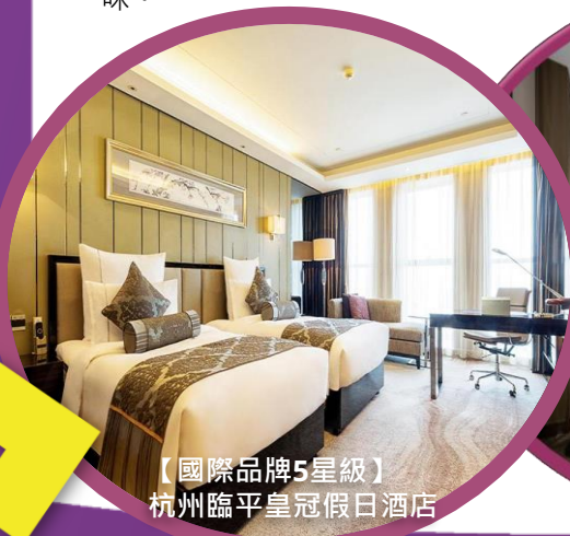
【國際品牌5星級】 杭州臨平皇冠假日酒店

拈花灣靠山面湖·生態秀美·建築以唐風宋韻為主·同時參照了江南水鄉的特色建造·配合集天地靈氣的地理環境。