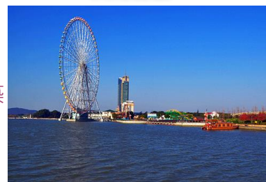
【太湖之星】水上摩天輪

『外灘』：由一段沿黃浦江的馬路和沿路的建築和設施構成，為上海重要的地標之一。外灘沿路坐擁二十多幢風格各異的歷史建築，有折衷主義的，也有文藝復興式的，還有早期現代式的，故而被譽為「萬國建築博覽群」。